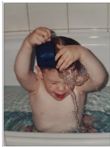
Här skapas tidig vattenvana...

Centralstyrelsens stående påminnelse till alla föreningar är att beställa UTMÄRKELSER för att uppmuntra och uppmärksamma framstående medlemmar i klubben. Beställ i god tid till ert årsmöte eller annat bra tillfälle att dela ut dessa! De förnämsta utmärkelserna; förtjänstmedalj i guld och hedersmedaljen, bekostas av IFK Centralstyrelsen. Att få en utmärkelse är en fin känsla av uppskattning från klubben efter de insatser man har gjort. Ännu gladare blir vi av det och ännu bättre jobbar vi för vår förening. Bestämmelserna för utmärkelserna finns på hemsidan: www.ifkcs.org . Kika där och beställ!!!