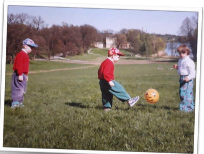
Ett barn och en boll i rörelse...

Vi som har lite sport och idrott i oss från början, är nog duktiga på att överföra det till våra barn. De föräldrar som har lite musik i sig från början, är nog också duktiga på att föra det vidare. Men tänk nu då om man inte har det ena eller andra? Då är det minsann svårt. Mina barn följde med till simhallen, rätt naturligt, när jag själv var tränare där, men jag tyckte att det var mitt ansvar att också visa dem andra möjligheter och intressen. Gitarr till exempel, eller dragspel. På den tiden fanns fortfarande kommunala musikskolan, så det gick ju bra en stund även om jag själv är och var totalt oduglig med ett instrument, och dessutom inte hade råd med någon privatundervisning för ungarna.