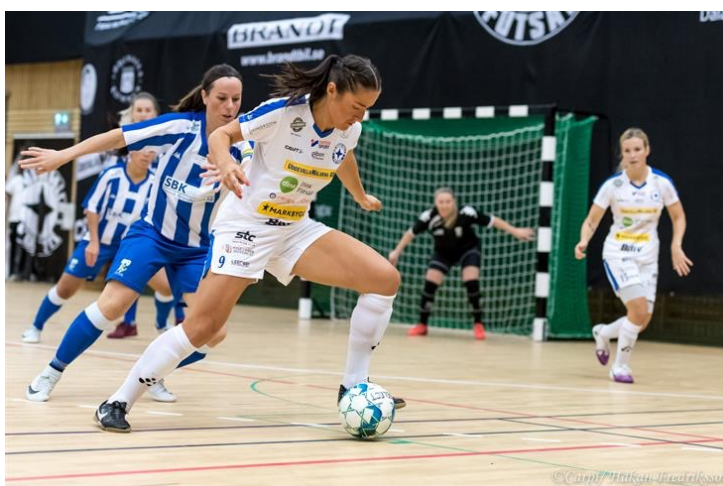
IFK Uddevalla Futsal i farten

Futsal är en ganska ny sport i Sverige, en variant av fotboll som spelas på en mindre spelyta med färre utespelare och den största skillnaden mot vanlig fotboll är bollstorleken, i futsal är den en storlek mindre och mer dämpad. Man skulle kunna översätta det med inomhusfotboll, men det är inte riktigt samma sak. Matchtiden är 2 x 20 min, spelytan mindre och antalet utespelare är fem. Ordet futsal kommer från portugisiskans futebol de salão. Sporten har egna officiella regler genom FIFA. Futsal skapades 1930 i Uruguay och kom till Sverige 2003. Här spelar vi på amatöرنivå och organiseras av Svenska Fotbollförbundet. Vi har numera både herr- och damlandslag i svensk futsal.