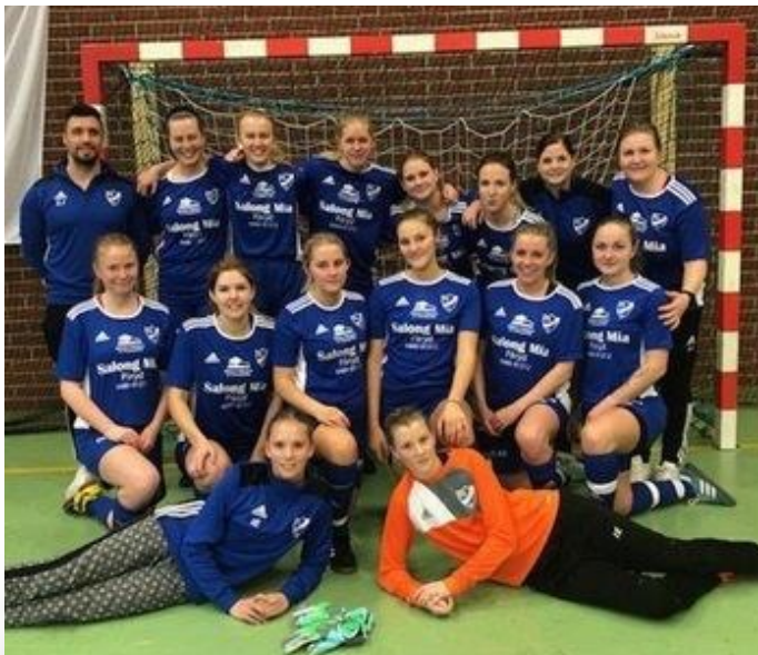
IFK Påryds duktiga damlag.

Föreningen sköter också om den allmänna utomhusbassängen på sommaren och sporthallen på vintern, och så säljer man bingolotter förstås, för att få in lite extra slantar till klubben. I bygden är det flera företag som sponsrar klubben, toppenbra för alla! Just i år jobbar man med att få i ordning ett utegym. Under sportlovet som kommer arrangerar klubben aktiviteter för alla elever, inte bara klubbmedlemmar. Hela veckan kan man spela badminton, bordtennis, innebandy och fotboll. Det låter verkligen som att en liten förening på en liten ort tar ett stort ansvar för att alla ska röra på sig mer, ha roligt tillsammans och få nya kamrater. Bra jobbat, tycker vi i Centralstyrelsen. Jättefin IFK-anda! Vi önskar er fortsatt många roliga matcher mot andra klubbar och all lycka i framtiden!