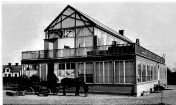
Ateljen i Lidingö i drift 1911-1919 (från boken "Den svenska drömfabriken").