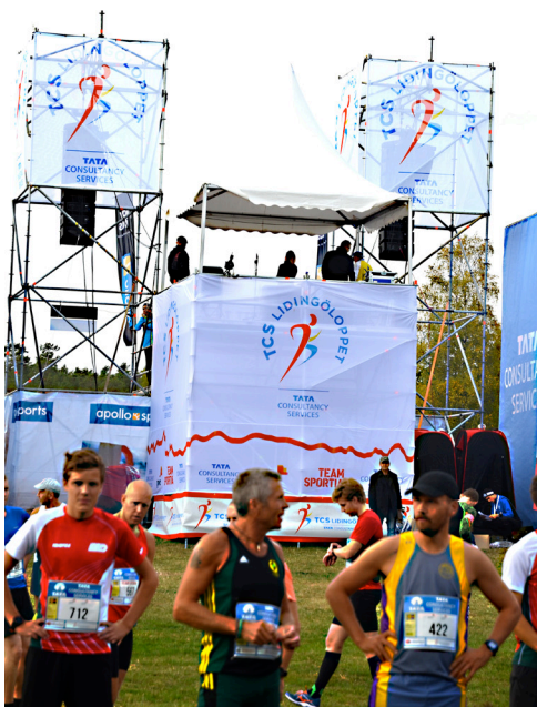
Startgärdet Koltorp för 30 km

Årets Lidingölopp är det 55:e sedan starten 1965. Då gällde det bara ett enda lopp på 30 km i ganska obanad terräng. Nu har mycket kring banan förändrats, Upplevelsen av naturen, backarna och inte minst det mjuka underlaget i Lidingöterrängen har stått i centrum för loppets nya kampanj "Asfalt är för bilar".