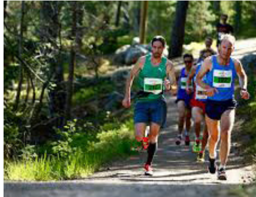
Ultramarathon på fina skogsvägar